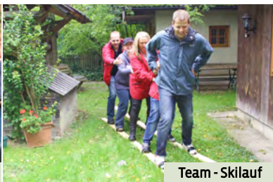
Team - Skilauf