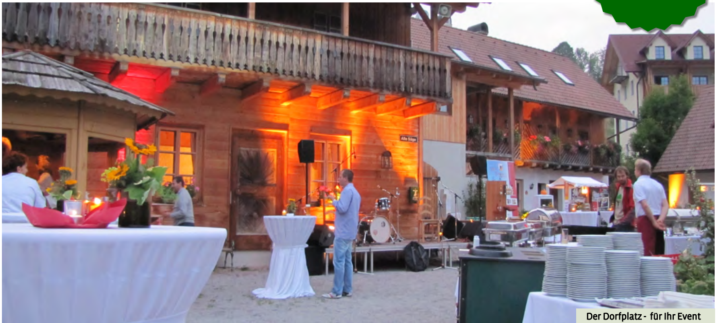
Der Dorfplatz - für Ihr Event