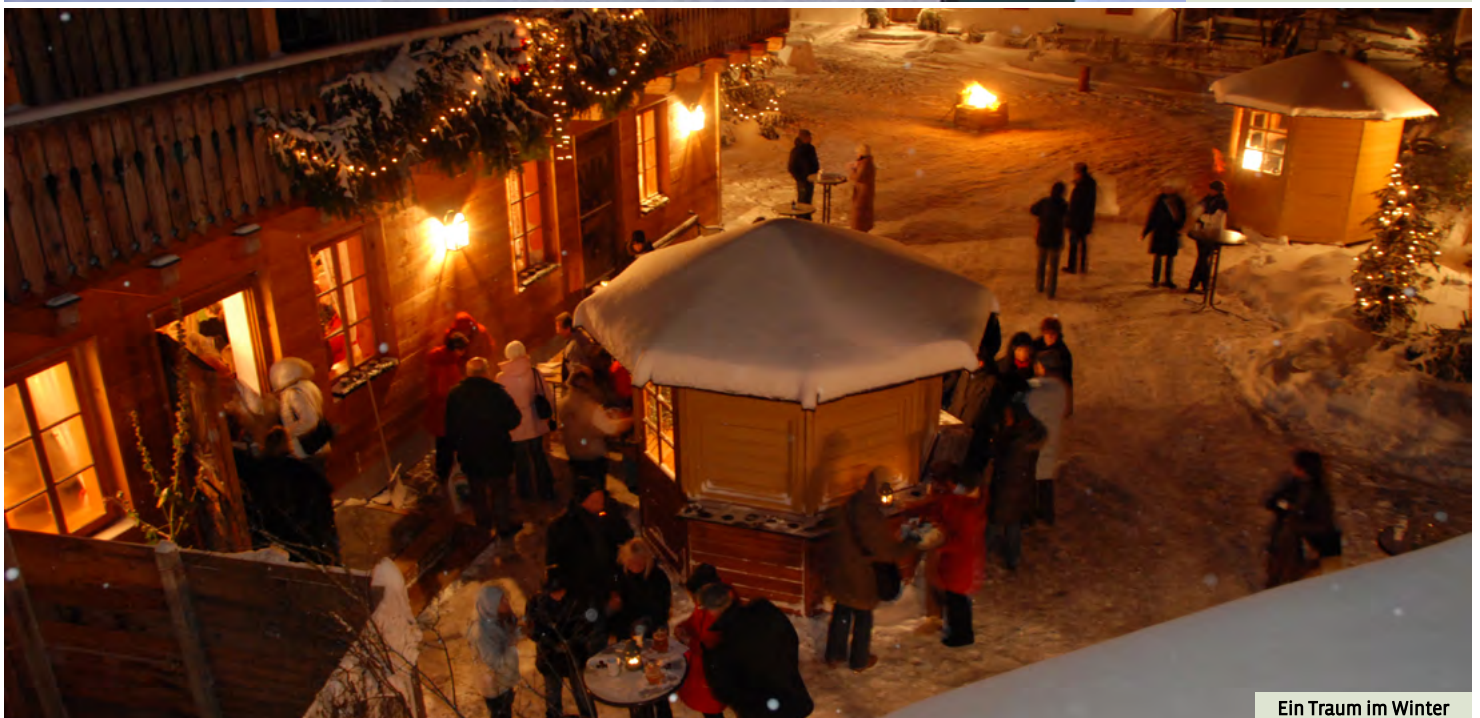
Ein Traum im Winter