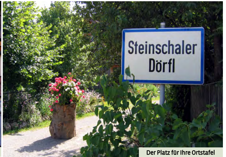
Der Platz für Ihre Ortstafel