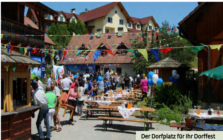
Der Dorfplatz für Ihr Dorrfest

Für die Dauer Ihrer Veranstaltung ist es Ihr Firmendorf . Das Steinschaler Dörfel, ein optimales Event- und Incentive-Dorf . Das kompakte Hotel-Dörfel bietet Ihnen dieses Dörfkonzept in einzigartiger Weise. Sie sind in einem Hotel-Dörfel, das organisatorisch in einer Hand ist, was viele Abläufe einfacher macht.